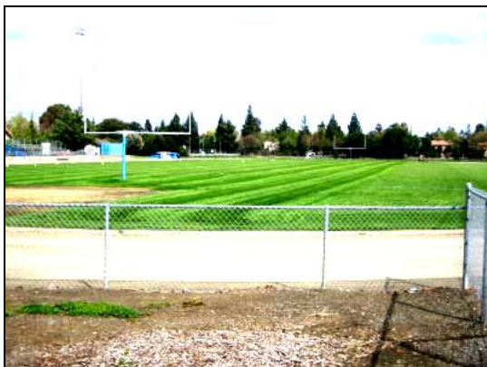
アメフトグラウンド