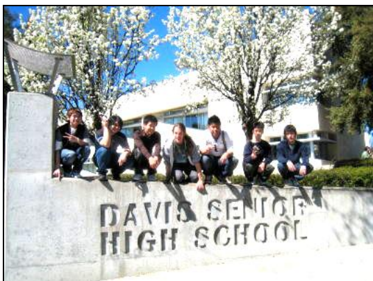
Davis High School