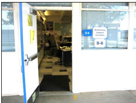
日本語授業の教室 S-6