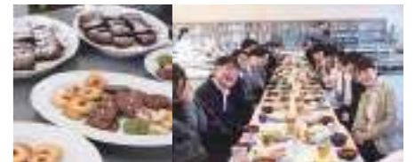
感謝のありがとうクッキー・ありがとうパーティー 感謝の気持ちを料理でおもてなし。