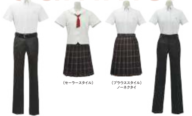
(セーラースタイル)