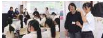
専門職の方々からの実技指導や講義 倉敷市保育士・保育所支援センターの専門職の方々から直接実技指導や講義を受けることができます。