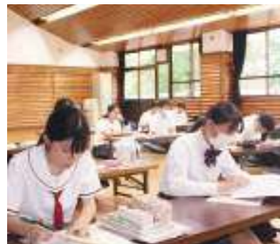
学習会 2日間、クラスのみならずしっかり勉強と向き合うことができます。