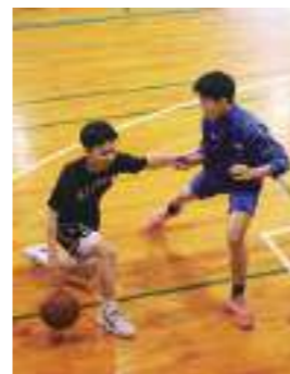
専攻実技 部活動の種目を授業の中でも集中して練習することができ、技術力を磨きます。