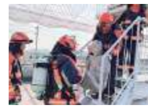
消防士体験 職業選択につながる体験授業を実施しています。