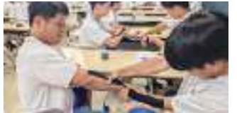
大学との連携授業 大学の先生からテーピングの巻き方、体の仕組みやメンテナンスの仕方を学ぶ機会もあります。