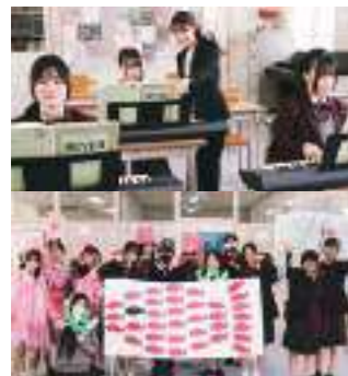
器楽の授業 ピアノは個別レッスンを受けることができます！歌唱練習やオペレッタなど保育の実践に役立つ授業が充実。