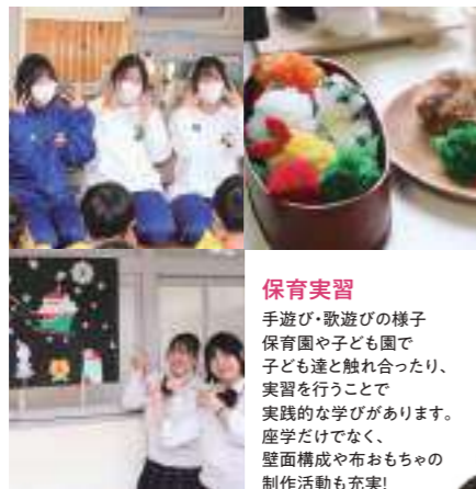
保育実習 手遊び・歌遊びの様子保育園や子ども園で子ども達と触れ合ったり、実習を行うことで実践的な学びがあります。座学だけでなく、壁面構成や布おもちゃの制作活動も充実！