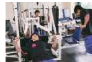
トレーニング 冷暖房完備の充実したトレーニングルームで筋力アップを目指します。