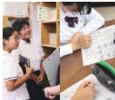
W☆ラボ 与えられたテーマについて、図書館等を利用して、知見を広げます。