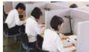
自習室 放課後の自習時間を確保。