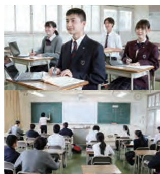
習熟度別授業 国・数・英を中心に習熟度別授業を展開。少人数で、より生徒の学力に応じた指導を展開します。