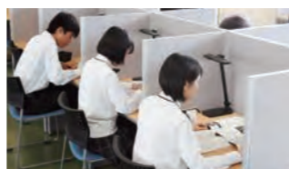
自習室 放課後の自習時間を確保。