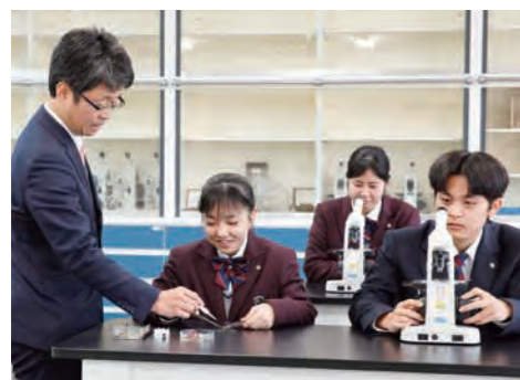
生物の実験 「触れられる・感じられる」体験学習。