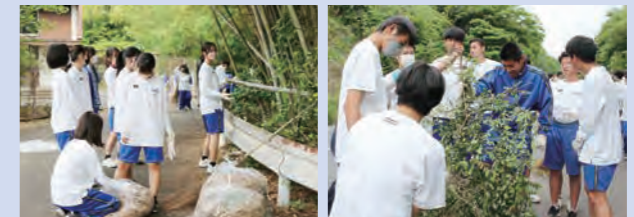
ボランティア活動に積極的に参加。毎年恒例の地域清掃。