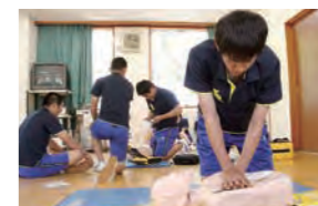
「スポーツ概論」の授業 心肺蘇生法も学習します。