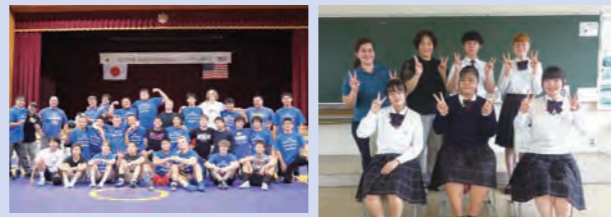
フランス、アメリカ、ニュージーランド、インドネシアなどから長期留学生を迎えています。