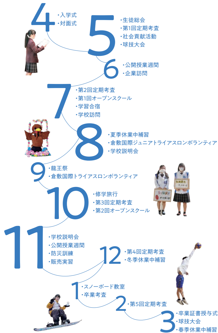
①②入学式 ③④球技大会 ⑤社会貢献活動 ⑥⑦企業訪問 ⑧⑨⑩学校訪問 ⑪⑫⑬龍王祭 ⑭⑮⑯修学旅行 ⑰⑱スノーボード教室 ⑲⑳卒業式

鷺羽高校では、一年を通じて様々な行事が行われ、生徒たちの学びと成長、そして楽しみが詰まっています。春から始まる入学式や対面式、学校訪問、そして夏のボランティア体験事業や龍王祭など、一つひとつの行事が生徒たちの心を豊かにし、思い出深い体験となっています。