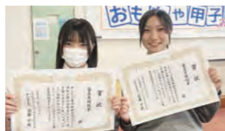
高校生おもちゃ甲子園 審査員特別賞を受賞しました。