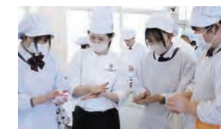
外部講師授業 外部講師による「本物」の授業。