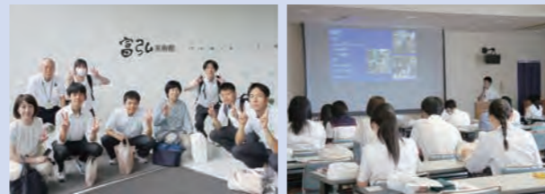
他県の生徒とディスカッションや実践発表など自分を成長させるチャンスがあります。